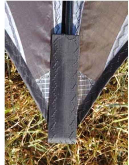
Kielabspannung und gewickelter Kielstab

Mit dem Maraca ist Christoph Fokken ein großer Wurf gelungen. Dieser Kite verbindet in überraschend gelungener Weise die brandheißen, wilden und temporeichen Freestyle-Manöver der neuesten Generation