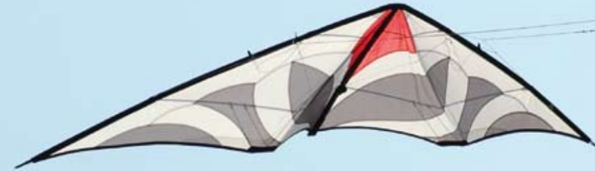
Die satte Fade-Lage des Maraca erleichtert den Backspin

Flatspins Der Drache wird aus dem Sturzflug durch schnelles Entlasten in die Bauchlage gebracht. Hierbei geht man dem Drachen mit einer Hand stärker entgegen als mit der anderen. Hierdurch kann der Drache, sobald er flach auf dem Bauch liegt, um 180° rotieren. Durch Anziehen an beiden Leinen geht man wieder in den dynamischen Weiterflug über.