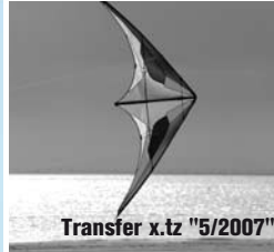
Transfer x.tz "5/2007"